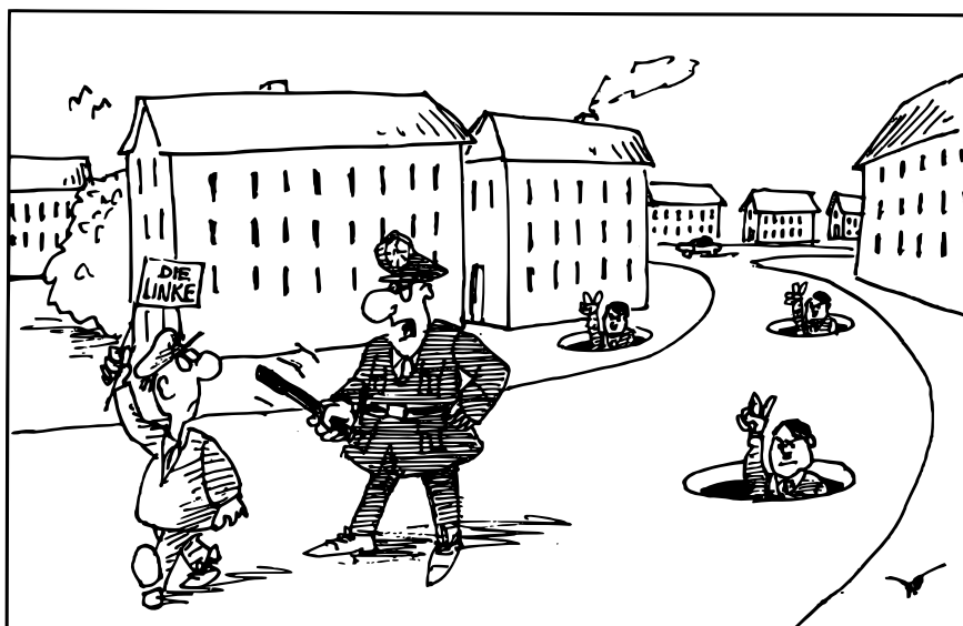
Was sind denn das für staatsgefährdende Umtriebe!

Karikatur, mit freundlicher Genehmigung, Kaiser, Esslinger Zeitung.