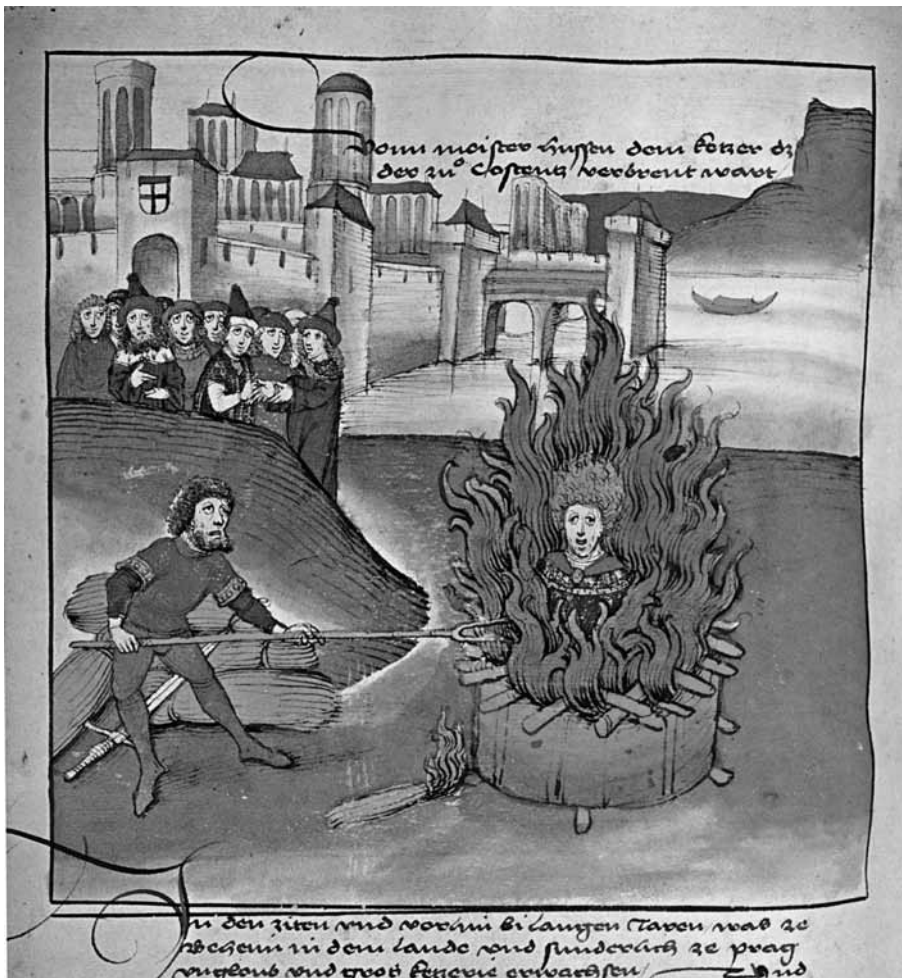
Eine Schandtats des Konstanzer Konzils: König Sigismund, Veranstalter des Konzils, sicherte dem böhmischen Kirchenreformer Jan Hus zunächst freies Geleit zu, aber die versammelten Kirchenfürsten ließen ihn dann als Ketzer verurteilen und weil er nicht widerrufen wollte, wurde er auf dem Scheiterhaufen verbrannt.