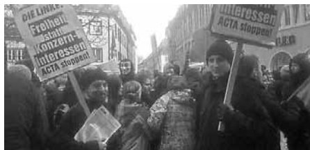
Demos gegen Acta in Stuttgart (links) und Mannheim (rechts)

Die Länder, die ACTA unterzeichnen, verabreden sich damit zu einer Verschärfung der Strafen bei Urheberrechtsverletzungen, aber auch schon bei „Beihilfe“ oder „Anstiftung“. Härtere Strafe soll es zudem auch für diejenigen geben, die Software zur Umgehung von Kopierschutzmaßnahmen entwickeln. Also beispielsweise Programme zum Kopieren von Musik-CDs. Vieles, was im ACTA-Vertrag formuliert wird, ist längst Realität. Der Überwachungsstaat hat seit den Terroranschlägen vom 11.