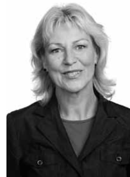
Dr. Dagmar Enkelmann