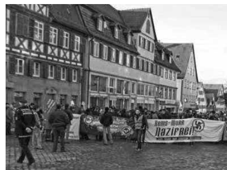
300 demonstrierten am 25. Februar in Schorndorf für „Rems-Murr nazifrei“. Am Abend fand eine Infoveranstaltung mit über 100 Teilnehmern statt und anschließend ein Konzert „Laut gegen rechte Gewalt“.

die NPD durch Legalität den Eindruck erwecken kann, ihre rassistische, antisemitische, antidemokratische Hetze sei ein legitimes „nationales“ Anliegen und solange sie sich überwiegend über Steuergelder finanzieren kann, schöpft die gesamte neofaschistische Szene daraus den Anschein von Legitimität. Nach Bekanntwerden der Morde dieser rechten Zwickauer Terrorzelle an mindestens neun Menschen ausländischer Herkunft und einer Polizistin blickten am internationalen Holocaust-Gedenktag Millionen Menschen auf Deutschland. Wie würde der Deutsche Bundestag auf die Frage antworten, wo die Ursache dafür zu suchen ist, dass Nazis unter den Augen staatlicher Organe solche abscheuliche Verbrechen begehen konnten. Bezug nehmend auf Artikel 139 GG gab die Bundesrepublik Deutschland vor der Vollversammlung der Vereinten Nationen am 31. Juli 1970 eine feierliche Erklärung ab, in der es heißt: „Das ausdrückliche Verbot von Naziorganisationen und das ausdrückliche Verbot, Nazitendenzen Vorschub zu leisten folgt aus dem Grundgesetz des Inhalts, dass die von alliierten und deutschen Stellen zur Befreiung vom Nationalismus und Militarismus verabschiedete Gesetzgebung weiter in Kraft bleibt.“