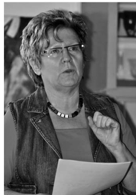
Regionalversammlung der LINKEN Nordostwürttemberg zur Wahl der Delegierten für den Bundesparteitag in Waldenburg (Hohenlohe)

Die Daten aller Würzburger EinwohnerInnen und Unternehmen werden über das Rechenzentrum des Bertelsmann-Konzerns in Gütersloh laufen. Dort ist die Datendrehscheibe, denn die Stadtverwaltung hat nicht die Rechnerkapazitäten, um ihre Verwaltungsprozesse zusammenzufassen und auf einer Internetplattform zu bündeln.