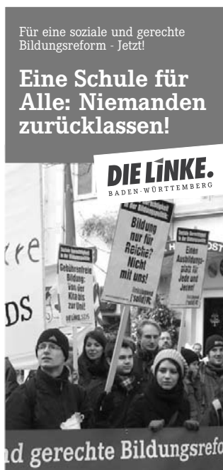
Flyer der Landes-AG Bildungspolitik, über das Landesbüro erhältlich.

Bundesinnenminister Schäuble und Baden-Württembergs Innenminister Rech sind für den Einsatz von Bundeswehr und Geheimdiensten im Inland. Das sind offenkundig verfassungsfeindliche Bestrebungen, die die beiden Herren unternehmen. Sie handeln dabei in Übereinstimmung mit den politischen Beschlüssen ihrer Partei, der CDU/CSU. Also verfolgt auch diese Partei offenkundig verfassungsfeindliche Ziele. Warum aber werden Schäuble und Rech sowie die gesamte CDU/CSU nicht vom