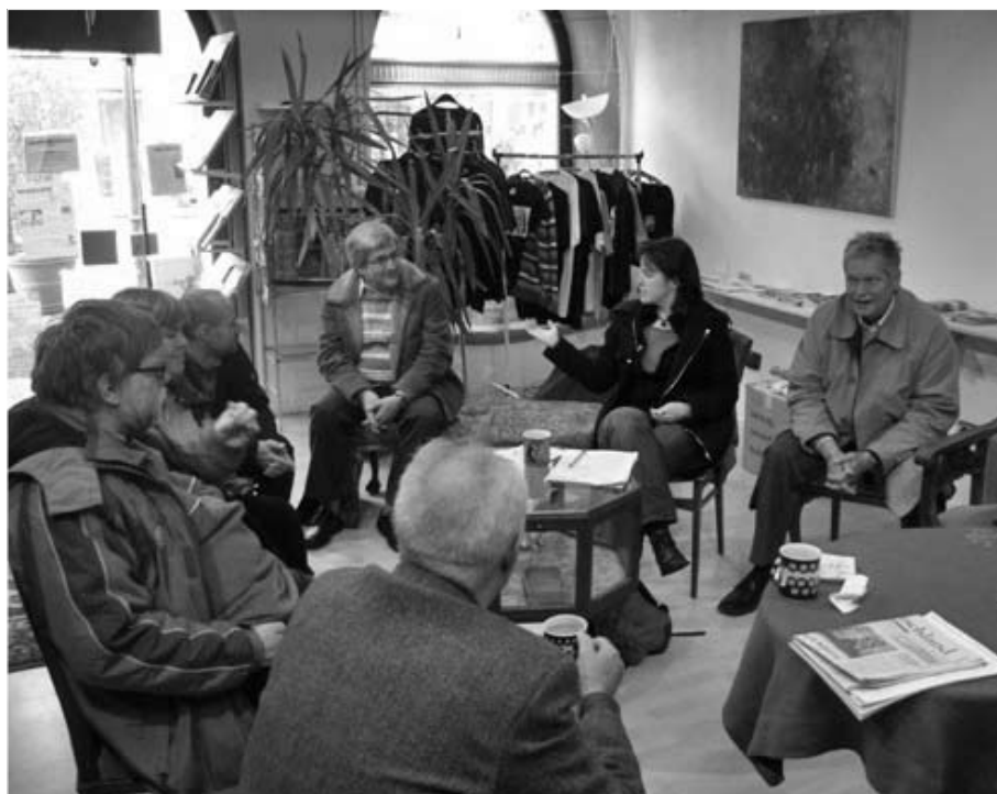
Drei Stunden diskutierte Heike Hänsel, Bundestagsabgeordnete der LINKEN, bei einem Abgeordnetennachmittag am 16. April im Kulturladen Rhizom in Ravensburg mit interessierten Bürgerinnen und Bürgern.

Rund 570 Mitarbeiter arbeiten in der Würzburger Verwaltung. Nach den Plänen von Arvato werden in den nächsten zehn Jahren 75 Stellen wegfallen. Das entspräche einem Einsparvolumen von rund 27 Millionen Euro. Nach Medieninformationen erhält Arvato davon 17 Millionen Euro, 10 Millionen Euro bleiben im städtischen Haushalt. In nicht offengelegter Weise ist die Vergütung Arvatos von der Höhe der Rationalisierung abhängig. Das Projekt ist auf zehn Jahre angelegt. Die Linke Würzburg fordert bisher vergeblich die Offenlegung des Vertrages zwischen Stadt Würzburg und Arvato, sowie aller dazugehörigen Nebenverträge.