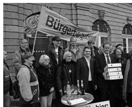
Das Heidelberger Bürgerbegehren gegen Wohnungsprivatisierungen übergibt 15.000 Unterschriften an den Heidelberger Oberbürgermeister Eckart Würzner.

„Das in Baden-Württemberg geltende Gesetz zu Bürgerbegehren (§ 21 der Gemeindeordnung) hat eindeutige Mängel. Der Gesetzestext ist so vieldeutig und legt den Bürgern ganz unnötige juristische ‚Fußangeln‘ aus, dass er geradezu dazu einlädt, politisch zu entscheidende Fragen auf die juristische Ebene abzuwälzen und einen Streit um die richtige Auslegung des Gesetzes zu beginnen.“