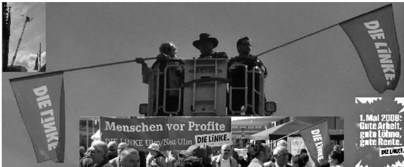
DIE Linke. in Ulm am 1. Mai 2008, auf den Straßen, auf dem Münsterplatz und über dem Münsterplatz.

der Vermögensverteilung ist noch einmal auseinander gegangen. 10 % besitzen über 60 % des Geldvermögens. 2/3 besitzen nichts. Sieht so eine gerechte Gesellschaft aus?