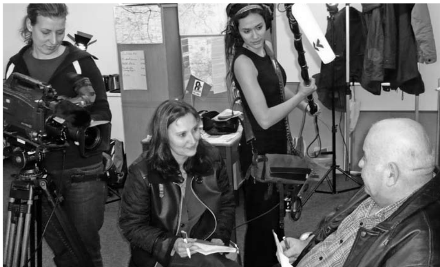
Am 18. März war ein Kamerateam des SWR-Fernsehens im Regionalbüro Ulm (Sendetermin: 9.4., Abendschau BW). Wegen der Entscheidung, dass im Herbst die Schließung des Ulmer SPD-Büros ansteht, war es für die FernsehmacherInnen wert zu berichten, dass die Linke in Ulm ein Büro eröffnet hat. Schlussfolgerung: Nicht nur (aber auch), weil es bei der Linken besser geht, geht es der SPD schlechter.

DIE LINKE fordert die Abkehr vom Freihandelsdogma und die schnelle Abschaffung der Agrarexportsubventionen zum Schutz der lokalen Produzenten vor den Importfluten aus der EU. Stattdessen: massive Unterstützung für die ländliche Entwicklung im Süden mit dem Ziel, dort Ernährungssouveränität zu erreichen oder wieder herzustellen.