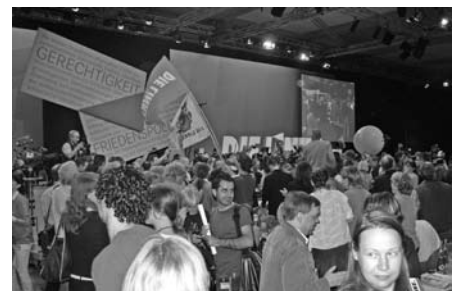
Eindrücke vom Parteitag am 16. Juni 2007 in Berlin