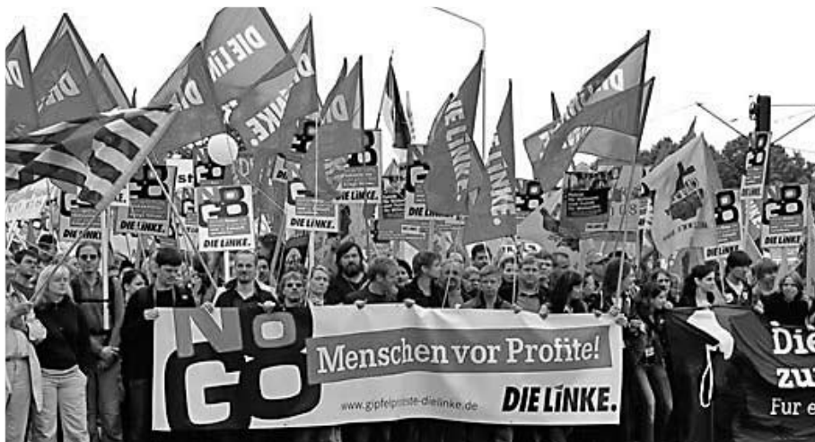
Rostock, 2. Juni.