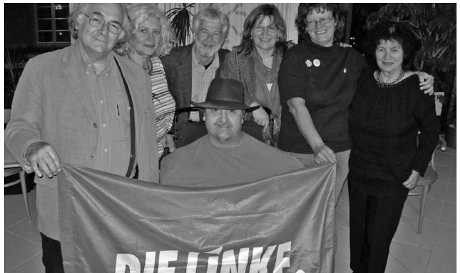
Kreisgründung in Tübingen am 5. Juli.